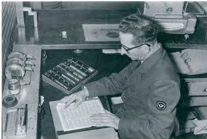
Arbeitshilfen erleichtern dem kriegsblinden Mitarbeiter die Arbeit am Schalter, Mülheim an der Ruhr, 1959

der zu fotografieren. An Filmmaterial gelangte man zu der Zeit, wenn überhaupt, nur durch Beziehungen, und den Umständen entsprechend provisorisch war das Labor – die Dunkelkammer: ein Kleiderschrank.