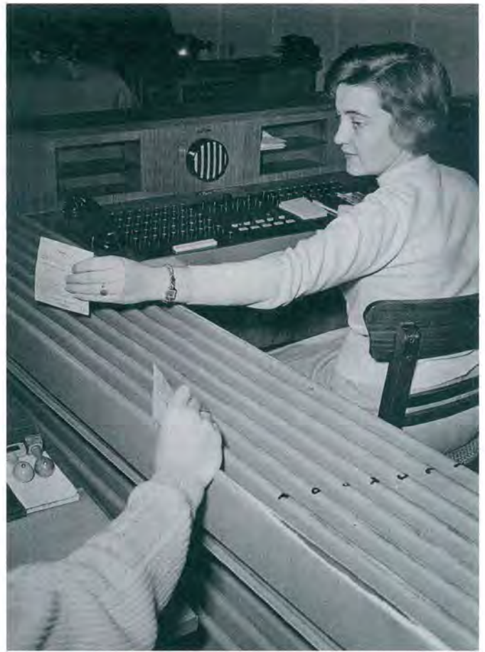
Ablage eines Kassenschecks nach der Anfrage und Beförderung auf dem Laufband an den Auszahlungsschalter, Postscheckamt Köln, 1958