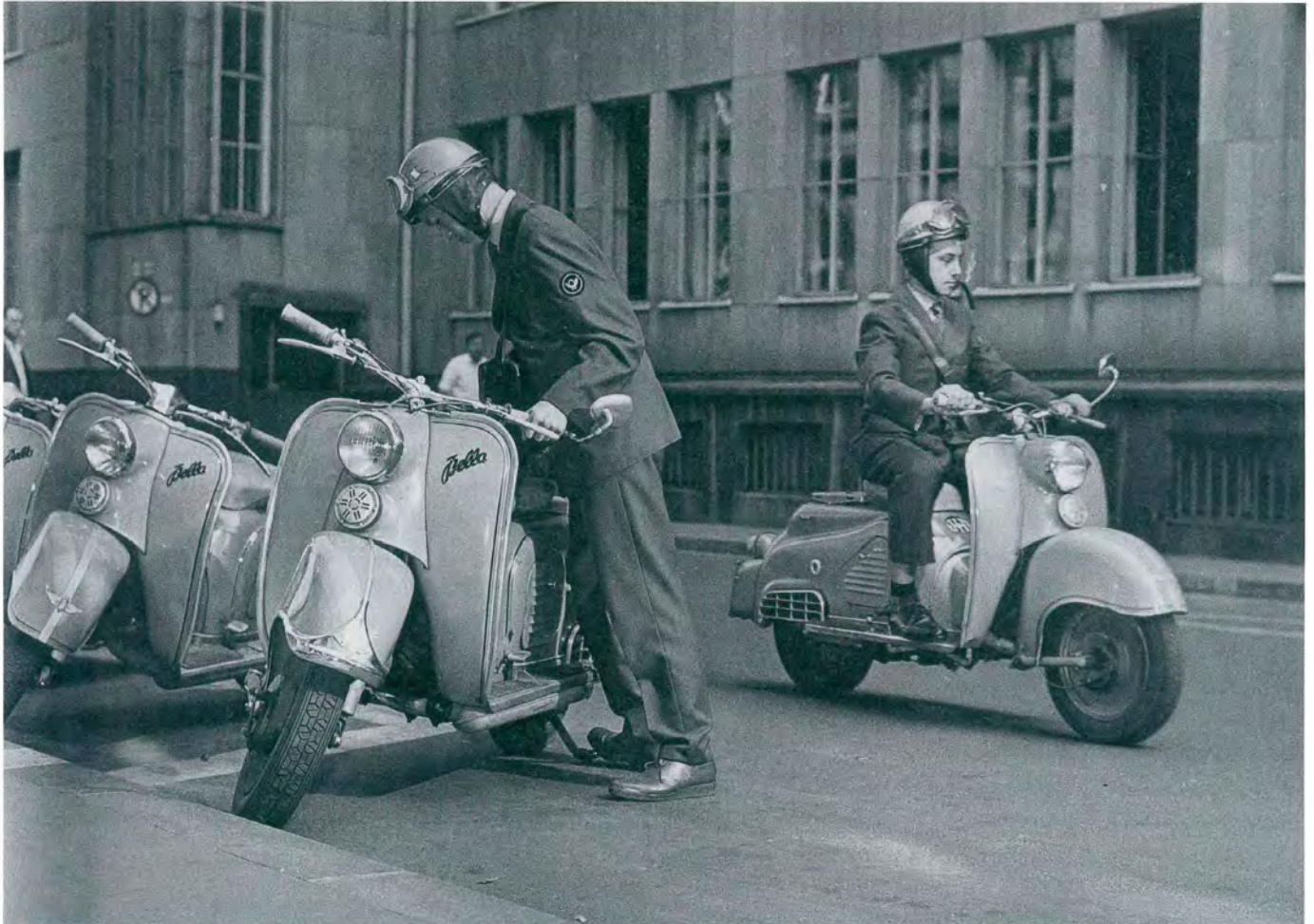
Eilzusteller auf dem Posthof eines Postamts in Köln, August 1959

Die Domstadt Köln lag nach dem Zweiten Weltkrieg in Schutt und Asche. Die Hohenzollernbrücke war zerstört, die Altstadt bestand nur noch aus Ruinen. Dass der Dom noch stand, schien vielen ein Wunder, war aber keins – sondern der gotischen Konstruktion und dem Einsatz unzähliger Helfer zu verdanken, die Wache hielten und Brände löschten.