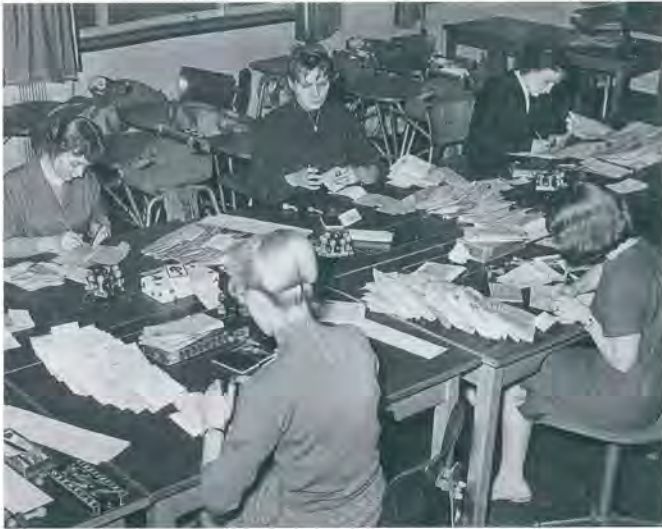
Verteil- und Sonderlistenstelle beim Postscheckamt Dortmund, 1958

Ein Jahr zuvor hatte Dick die Arbeit in den Postscheckämtern in Köln und Dortmund dokumentiert. Die Fotos, die zum Beispiel eine Sicht in die Säle bieten, wo die Mitarbeiterinnen die Belege sortieren und ablegen, wirken auf den ersten Blick unspektakulär. Sie zeigen aber Dicks Blick für das Wesentliche. Die Bildkompositionen wirken nie gestellt, sondern sind von einer eindrücklichen Leichtigkeit und Eindringlichkeit, die uns auch heute noch gefangen nehmen. Sachlich und gekonnt auch die Fotografien Postangehöriger im Arbeitsprozess, sei es an der Hochdruckstempelmaschine oder beim Ablegen von Schecks.